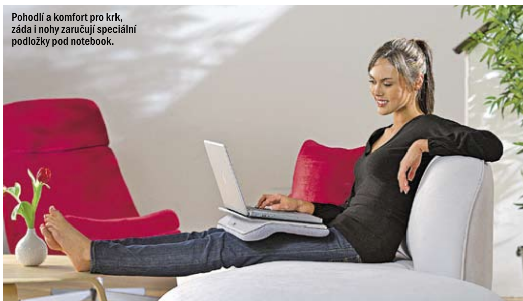
Pohodlí a komfort pro krk, záda i nohy zaručují speciální podložky pod notebook.